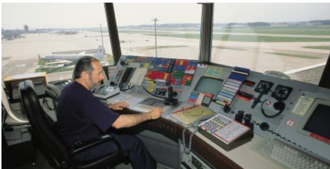
Point de vue imprenable depuis la vigie.

Les hommes de vigie assurent également le déclenchement des alarmes des équipes du Détachement de spécialistes en dépiégeage