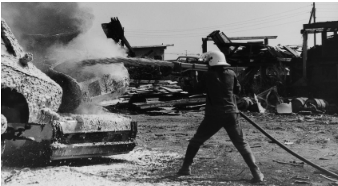
Entraînement dans les années soixante.

qu'en agissant ainsi, je leur donnais la dignité de leur tâche. Je dois reconnaître que, pour cela, j'ai toujours eu le soutien de mes directeurs, même si cela n'a pas toujours été acquis d'avance...»