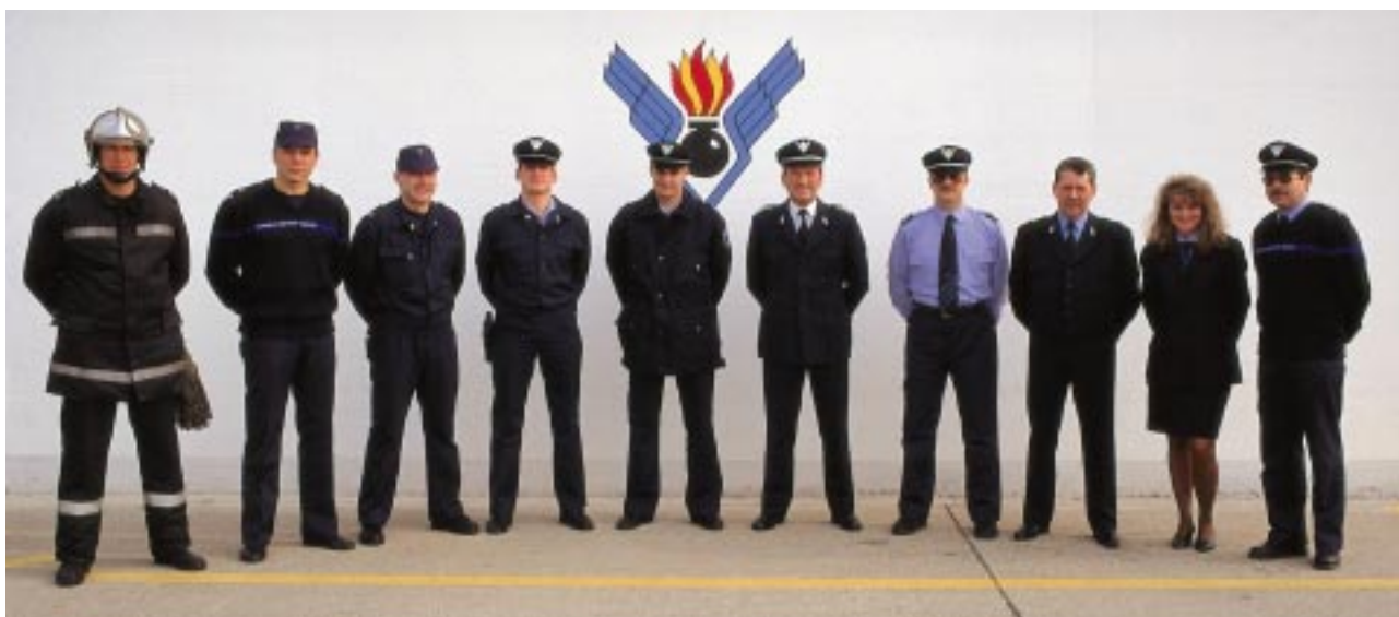
La panoplie d'uniformes du SSA.

comme il n'est plus possible, en Suisse, de réaliser des grands feux d'hydrocarbures pour simuler ce que serait une catastrophe aéronautique, les sapeurs se rendent à Teeside, dans le nord de l'Angleterre, où se trouve un centre spécialisé dans l'entraînement des sapeurs d'aviation. Là, ils subissent véritablement l'épreuve du feu. Pendant une semaine, ils vont connaître des situations très proches de la réalité, devant rentrer dans des carcasses d'avions en flammes, pour apprendre à maîtriser leurs réactions face à cet adversaire impitoyable qu'est le feu. Ils y subissent des chaleurs extrêmement fortes, une tension de tous les instants. Sur place, ils utilisent leur propre matériel, afin de le tester en grandeur nature.