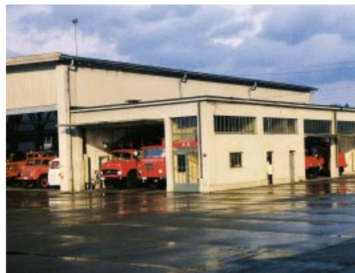
La première caserne.