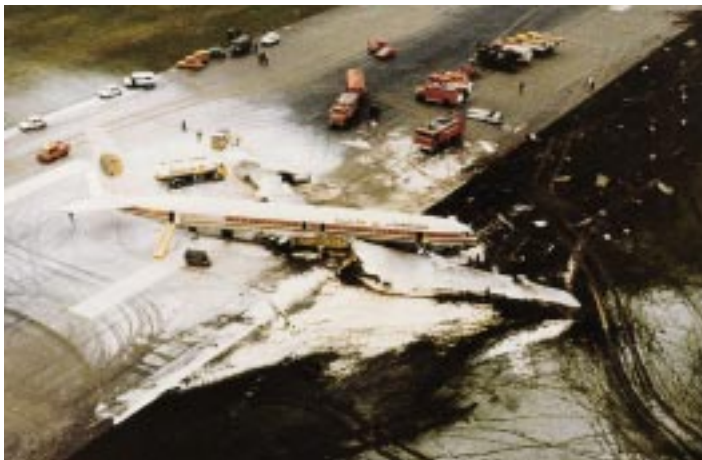
Le Boeing 707 d'Egyptair.