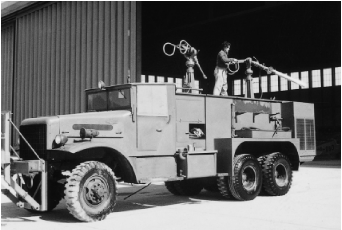
Le premier véhicule du SSA.